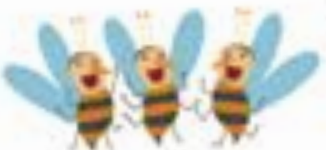
Die zu zweit und zu dritt singenden und tanzenden Bienen